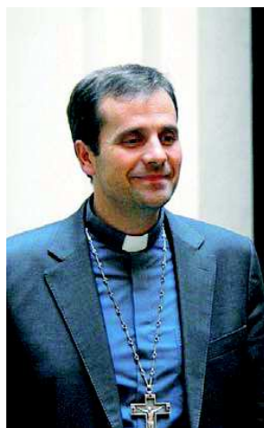
El bisbe de Solsona, Xavier Novell, en una imatge d'arxiu al Palau Episcopal.

El bisbe de Solsona, Xavier Novell, va demanar-se en la seva última glossa dominical si l'homosexualitat podria estar vinculada amb l'absència de la figura paterna. En el seu escrit, titulat Amor que esdevé fecund , el bisbe citava un text del papa Francesc sobre la família que diu: "Hi ha rols i tasques flexibles, que s'adaptin a les circumstàncies de cada família, però la presència clara i ben definida de totes dues figures, femenina i masculina, crea l'àmbit més adient per a la maduració de l'infant". A continuació, Novell es plantejava si "el fenomen creixent de la confusió en l'orientació sexual" de bastants nois adolescents no es podria deure al fet que —i tornava a citar el Papa— "en la cultura occidental, la figura del pare estaria simbòlicament absent, desviada, es-