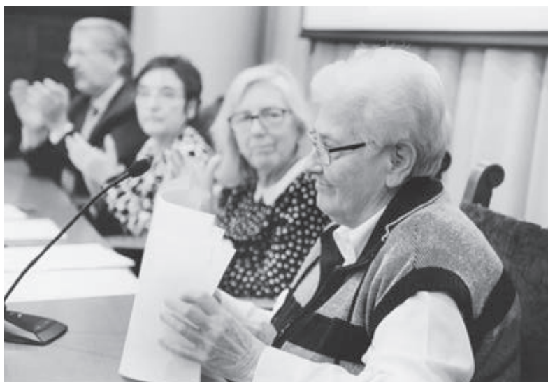
Taula de l'Acte d'Homenatge del Col·legi de Treball Social i de la Universitat de Barcelona (26 de febrer de 2015).