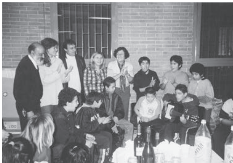
Equip de Mediació del Projecte del Barri del Bon Pastor (Barcelona). Curs 1999-2000.