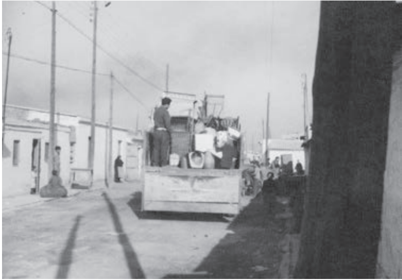
Octubre 1966. Sortida dels camions amb destí a Sant Roc (Badalona).