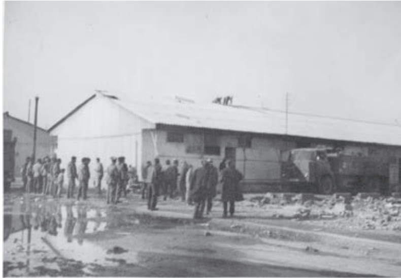
Sant Roc (Badalona) . 18 de desembre 1967. 50 famílies són expulsades de Sant Roc, amb destí (desconegut) a barraques buides de La Perona.