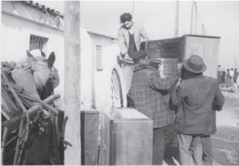
Octubre 1966. Gitanos carregant mobles per portar-los al camions que anirien a Sant Roc (Badalona).